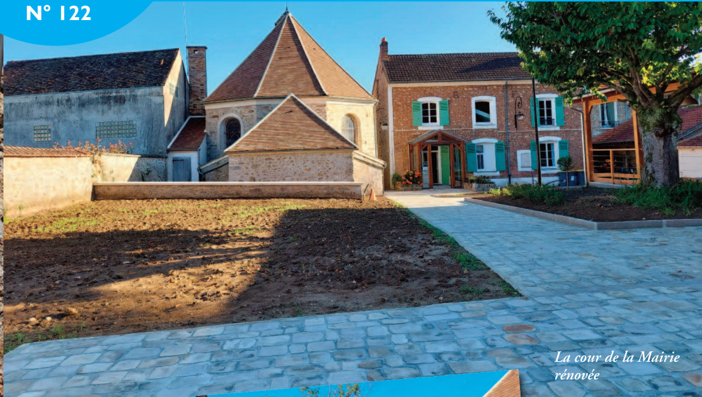
La cour de la Mairie rénovée